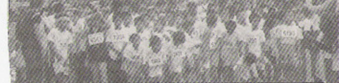
Ang pagsisimula ng Boys Division 10-11 yrs. old age category.