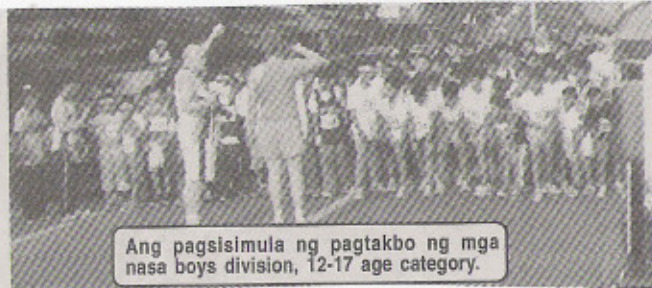
Ang pagsisimula ng pagtakbo ng mga nasa boys division, 12-17 age category.