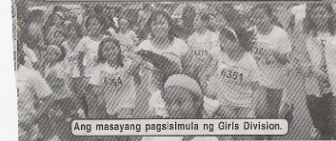
Ang masayang pagsisimula ng Girls Division.