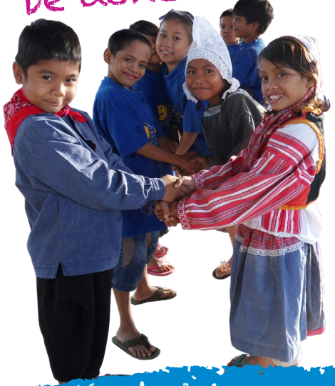
Kindertehuis op de Filipijnen

Namens de kinderen: Salamat Po! (Heel hartelijk dank!)